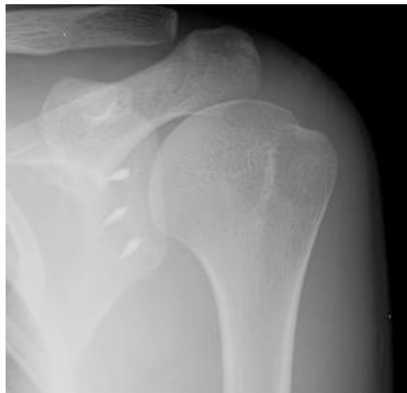
Fig. 1: Control radiográfico de reparación artroscópica del Bankart anterior.

Todos los hombros fueron operados siguiendo la misma técnica quirúrgica. El procedimiento se llevó a cabo en posición de silla de playa a 70° (sentada). Se realizaron portales artroscópicos habituales. Considerando los hallazgos artroscópicos, se realizó un desbridamiento amplio del labio anterior del cuello glenoideo, colocando los anclajes, principalmente tres (fig. 1), sobre el cartílago articular en la mayoría de los casos y reparación artroscópica del Bankart anterior. Se encontraron 1 Bankart óseo y 6 lesiones de labrum posterior, 7 lesiones de SLAP asociadas: 5 (II) y 2 (IV) y fueron fijadas con anclajes. Se encontró lesión de Hill-Sachs enganchado en 1 de ellos que fue reparado mediante técnica de Remplissage.